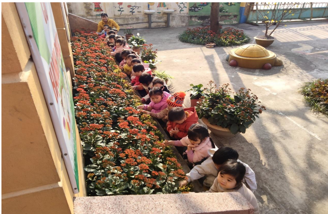
Cô giáo cùng các con đang quan sát vườn hoa

*Môi trường ngoài lớp học: Vườn trường có đa dạng các khu vực: “vườn hoa của bé”, “vườn cây ăn quả” “vườn rau” để trẻ quan sát