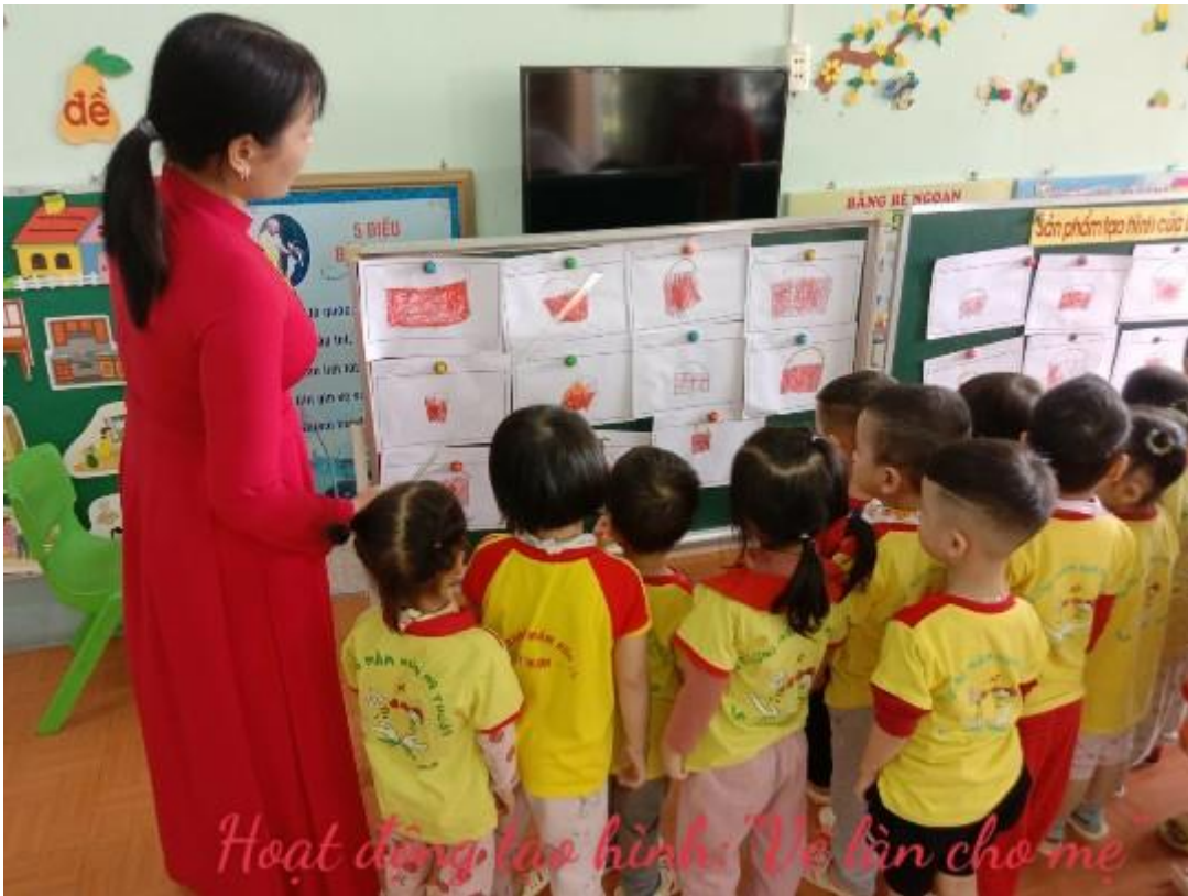
Hoạt động tạo hình Vẽ bàn cho mẹ